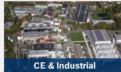
CE & Industrial